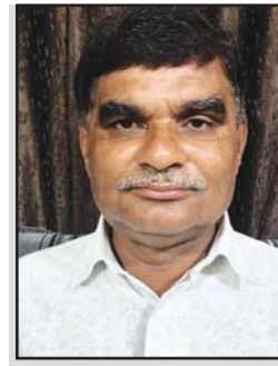
वल्लभ यमुनेश्वरी नैनपुर

यमुनोत्री से आकर धरा पर, प्रेम इस जग को सिखाया। राधिका की भावना ने, श्रीकृष्ण को मधुरिम बनाया। आराधना करता सदा मैं, आपकी 'यमुनेश्वरी'। आपकी कृपा से यमुना, सृजन का यह मार्ग पाया।