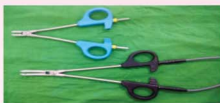
व्हेसल सिलर क्लैम्प