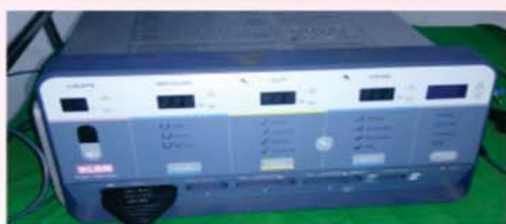
व्हेसल सिलर मशिन