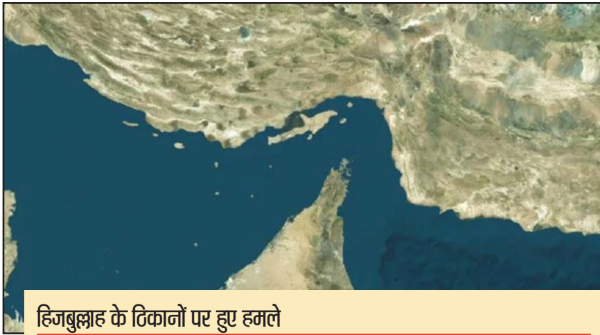
हिजबुल्लाह के टिकानों पर हुए हमले

आईआरएनए की रिपोर्ट के मुताबिक, लेबनान पर इजरायली हमलों के बाद ईरान ने स्ट्रेटिजिक वॉटरवे से तेल टैंकों का आना-जाना रोक दिया है, जिससे ग्लोबल एनर्जी सप्लाय रूट्स को लेकर नई चिंताएं बढ़ गई हैं। मंगलवार को ट्रंप की ओर से घोषित सीजफायर एपीएमेंट के बावजूद, इजरायल ने लेबनान में अपने मिलिट्री ऑपरेशन जारी रखे हैं। लेबनान की हेथ मिनिस्ट्री के मुताबिक इजरायल के हमलों में कम से कम 112 लोगों की मौत हुई है और 800 से अधिक लोग घायल हुए हैं।