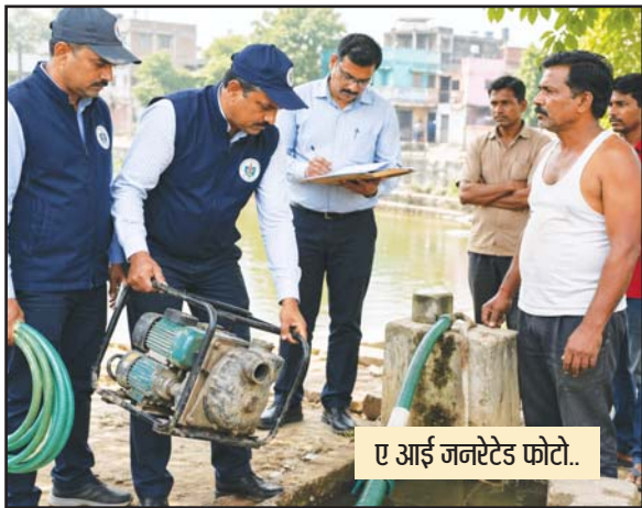
ए आई जनरेटेड फोटो..

नपा सीएमओ ने की नल कनेक्शन में मोटरपंप का उपयोग ना करने की अपील