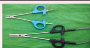
व्हेसल सिलर क्लैम्प