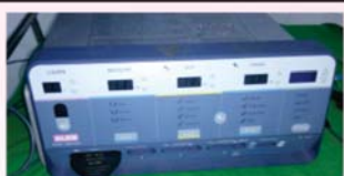
व्हेसल सिलर मशिन

अत्याधुनिक व्हेसल सिलर, लेजर व क्षारसुत्र द्वारा दर्दरहित सफल चिकित्सा