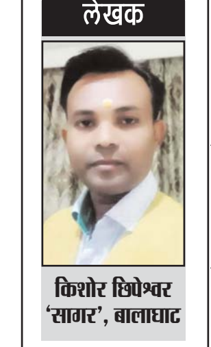
लेखक किशोर शिपोश्वर 'सागर', बालाघाट