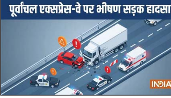
पूर्वांचल एक्सप्रेस-वे पर भीषण सड़क हादसा

कंधारपुर थाना क्षेत्र में पूर्वांचल एक्सप्रेस-वे के 238 माइल स्टोन के पास शनिवार को एक दिल दहला देने वाली दुर्घटना हुई। करीब एक किमी तक ट्रक में फंसी कार घसीटती गई।