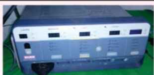
व्हेसल सिलर मशिन

अत्याधुनिक व्हेसल सिलर, लेजर व क्षारसुत्र द्वारा दर्दरहित सफल चिकित्सा