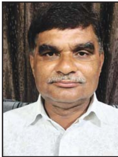
वल्लम यमुनेश्वरी नैनपुर

संस्कृति उभय राष्ट्र की, शिवात्मक ही है। प्रकृति उभय राष्ट्र की, सौन्दर्यात्मक ही है। भारत व नेपाल दोनों, आध्यात्म से परिपूर्ण 'वल्लभ'। आकृति उभय राष्ट्र की, कलात्मक ही है।