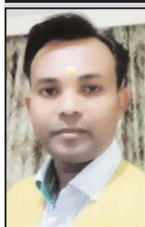
किशोर छिोश्वर 'सागर', बालाघाट

मन करता है बेटे जब भी हम तन्हाई मे इश्क का नहीं हैं मर्ज सोचा गज़ल लिखें