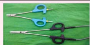
व्हेसल सिलर क्लैम्प