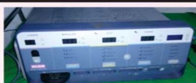
व्हेसल सिलर मशिन

अत्याधुनिक व्हेसल सिलर, लेजर व क्षारसुत्र द्वारा दर्दरहित सफल चिकित्सा