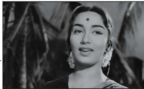
लता मंगेशकर की आवाज ने इस गाने को बनाया यादगार..

डेस्क जगप्रेरणा। दम मारो दम, पल पल दिल के पास, रश्के कमर और चुनरी चुनरी जैसे गानों के ओरिजिनल वर्जन आज भी अपने धून, शब्दों और पसंद किए जाते हैं। ऐसे में कई बार इन सुपरहिट गानों का रिमेक्स भी बनाता है, लेकिन लोगों को पसंद नहीं आता है।