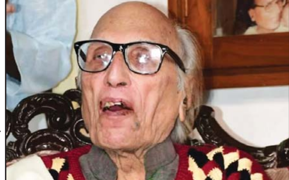
एमयू से शुरू हुआ सफर और मेरठ का वो गहरा जख्म..

डेस्क जगप्रेरणा। उर्दू अदब और आधुनिक गजल के सबसे चमकदार सितारे डॉ बशीर बद्र साहब ने 91 वर्ष की उम्र में इस फानी दुनिया को अलविदा कह दिया। बशीर बद्र को गजल विधा में ठेठ, सरल और बेहद रूमानी शब्दों को पिराने के लिए हमेशा याद किया जाएगा।