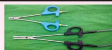
व्हेसल सिलर क्लैम्प